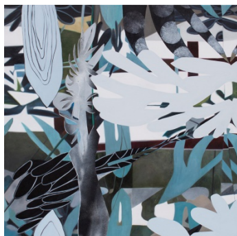
Victory Garden, 2017, 90,5 x 91 cm, AaL