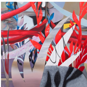
Red Snake, 2017, 101,5 x 101,5 cm, AaL

Die Tatsache, dass diese Gärten lebendig wirken, ist ein Merkmal der Qualität des Gärtners und die weise Wahl, die er bei der Gestaltung seines Materials getroffen hat.