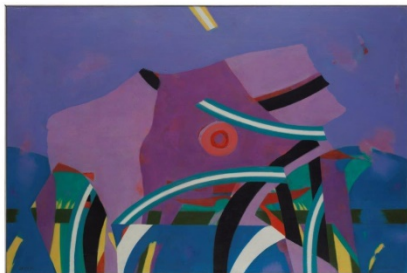
Tropisch, 97 x 146 cm, 1972