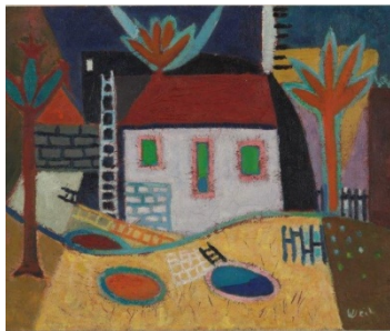
O.T., 40 x 50 cm, 1950