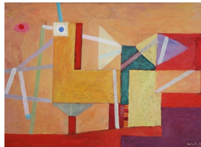
Landungssteg, 43 x 62 cm, 1954