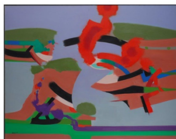
Insel, 114 x 146 cm, 1971