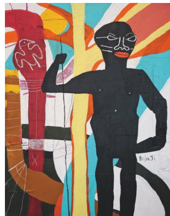
Adébayo Bolaji, The Crossover