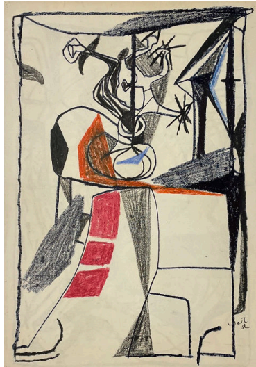
O.T., 1952, Ölkreide auf Papier, 61 x 43 cm

Ernst Weil, der gerade durch die große und sehr sehenswerte Retrospektivausstellung "Spontan und konstruktiv" im Museum Giersch in seiner Heimatstadt Frankfurt a.M. gewürdigt wird (s. Artikel in der FAZ), hat nicht nur ausdrucksstarke Ölbilder, sondern auch in allen Schaffensperioden wunderschöne Zeichnungen, z.T. als Studien für seine Gemälde geschaffen. Schon in der frühen Münchner Zeit in den 50-er Jahren entstanden dabei sehr eigenwillige, humorvolle und poetische Stillleben in verschiedenen Abstraktionsgraden. Wir zeigen eine ausgesuchte Auswahl aus diesen Arbeiten sowie einige der hochenergetischen, dynamischen Boxerzeichnungen aus seiner Pariser Zeit aus den späten 50-er und frühen 60-er Jahren.