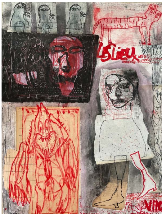
Serie „On Garde L'Essentiel“, 2025, Mischtechnik auf Karton, 80 x 60 cm

Einladung zur Eröffnung der Ausstellung am 12.06.2026, 19 – 21 Uhr