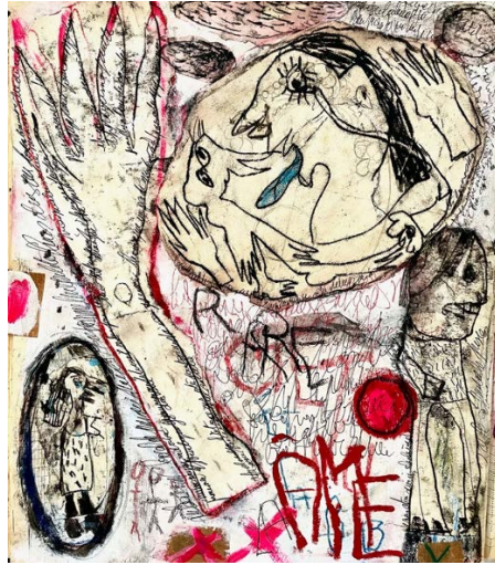
Serie "Contes à Rebours", 2025, Mischtechnik auf Papier, 43 x 37 cm

T. +49 30 469 98 068 /+49 176 647 27 247 - www.galerie-kremers.com - info@galerie-kremers.de