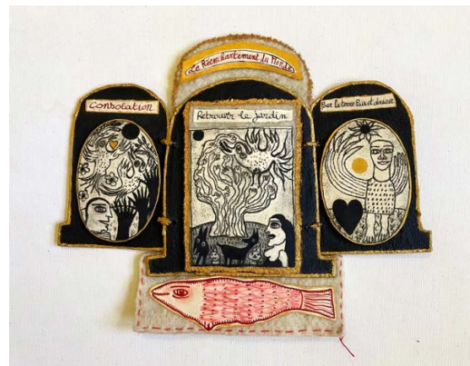
Exvotos „Quel que soit ton Voeu le plus cher“ und „Retrouver le Jardin“, Filz, Fäden und Zeichnungen auf Papier auf vergoldetem Karton